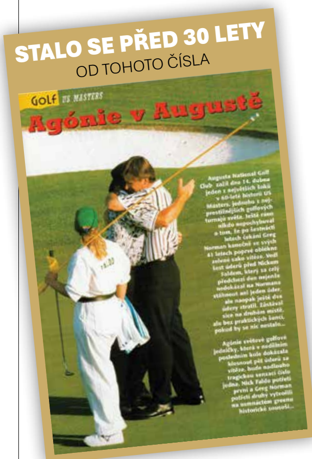
čtěte na str. 3...